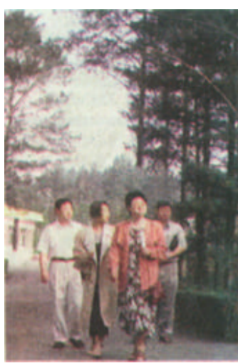
观天然红松林、漂流汤河和黑龙江省小兴安岭林区绿色生态旅游受到国内外游客欢迎，近日最多时每天逾两万人，预计全年该林区旅游总收入可达四千万。图为一批旅游者来到小兴安岭。